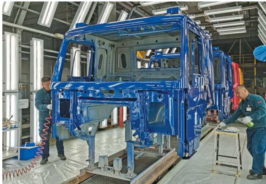
揭榜挂帅，创新突破

为深入挖掘问题根源，车身二部管理团队深入生产一线，倾听员工心声，与基层技术人员开展深入交流。通过多维度分析，从人员操作规范性、设备运行稳定性到工艺设计合理性等各个方面，进行了全面细致的诊断，形成了清晰的问题脉络图，为后续制定改进措施提供了科学依据。