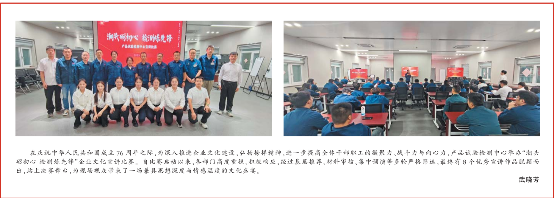
在庆祝中华人民共和国成立76周年之际，为深入推进企业文化建设，弘扬榜样精神，进一步提高全体干部职工的凝聚力、战斗力与向心力，产品试验检测中心举办“潮头砺初心 检测炼先锋”企业文化宣讲比赛。自比赛启动以来，各部门高度重视、积极响应，经过基层推荐、材料审核、集中预演等多轮严格筛选，最终有8个优秀宣讲作品脱颖而出，站上决赛舞台，为现场观众带来了一场兼具思想深度与情感温度的文化盛宴。

冲刺四季度，大干正当时！济南发动机厂将以更加坚定的决心、更加昂扬的斗志、更加务实的作风，全力以赴冲刺年度任务目标，以优异成绩为集团公司迈向世界一流贡献力量！